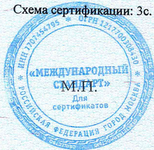
Схема сертификации: Зс.